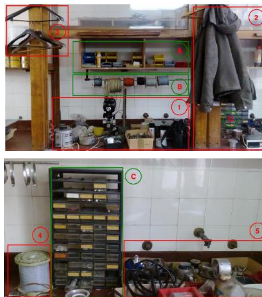
Slika 1. Prikaz neadekvatnog radnog prostora za spajanje mehaničkih i elektronskih sklopova

Kao primer realizacije i primene 5S alata u ovom radu biće analiziran jedan deo procesa pri finalizaciji i montaži transmitera pritiska i temperature. Na osnovu ovog primera, želeli smo da pokažemo da li ovaj alat ispunjava ulazne preduslove pre primene Kaizena, sa aspekta otklanjanja svih otpada koji se ne bi kasnije razmatrali.