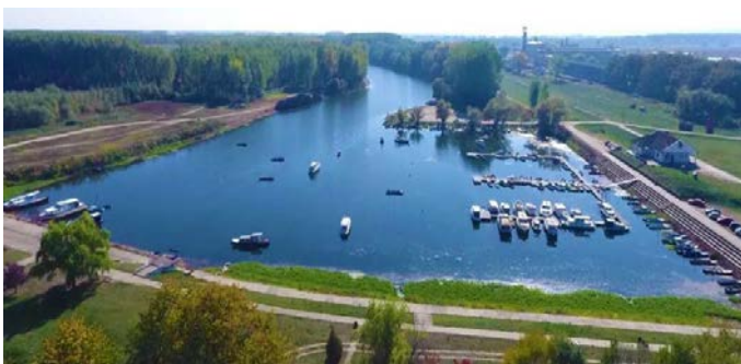
Figure 1. Kovin Dunavac marina (Kovin, Serbia)

This research aimed to assess the biotoxicity of water from the Kovin Dunavac marina to Aliivibrio fischeri .