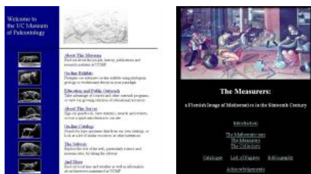
Sl.1 Pionirske verzije muzejskih prezentacija u svetu i prve izložbe u elektronskom prostoru [6].

U prvoj deceniji ovog milenijuma, u oblasti konzervacije nasleđa dolazi do novog shvatanja zapisa, koji više ne predstavlja akumulaciju standardnih informacija i podataka, već kulturni artefakt. Time se korisnicima omogućava stvaranje novih poredaka i kreativnije korišćenje informacija, a arhive više nemaju evidenciono-memorijalnu, već aktivnu kulturnu misiju [3]. Imajući u vidu odnose paradigmi, koje se u skladu sa dijalektikom promena naučnih teorija uspostavljaju [4], bilo bi teško održivo stanje samo delimične transformacije dokumentacije kao kulturne potpore, kakvo je bilo nastojanje tradicionalno obrazovanih konzervatora. Sistem dokumentacije mora da prati savremene tokove društvenog razumevanja kulturne baštine, gde se procesi stvaranja dokumenata i čuvanja pokazuju kao prvoprazredni kulturološki činovi u polju gde se smena paradigmi neosporno događa [5].